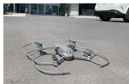
上：タイムラプス撮影用カメラ 下：空撮に使用したドローン

▶タイムラプス&ドローン 動画公開ページ acl-jp.com/wemoved/