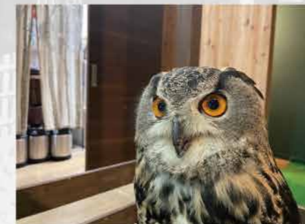
ミミスクの一種(多分...)。眼力強め。

さて、フクロウをしっかりと愛で気分もすっきりしたところで、食欲の秋にぴったりな足利の銘菓をご紹介します。