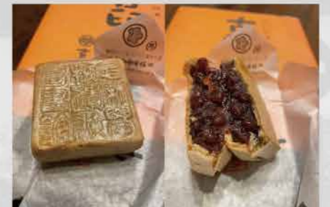
古印最中。お腹が減っている時に見てはいけない(笑)

足利と聞いてピンとくるお土産って?なかなか思いつかないと思いますが、「大麦ダクワーズ」や「COCO FARM WINERY」で11月に行われる収穫祭を連想される方が多いでしょう。それらもちろんお勧めですが、個人的には冒頭に登場した古印最中をお勧めします!えっ!!最中かよ?って思ったでしょ?いえいえ大変正直な感想です。ただ、だまされたと思って是非一度食って頂きたいのです。もの凄くうっすーい最中の中にぎっしりと粒あんが詰まっっていて、緑茶と嗜むのも、白ワインのお供にも、もちろんコーヒーにも合います。有名な政治家や、タレントさんもわざわざお忍びで買いに来るとか?(ホントの話)