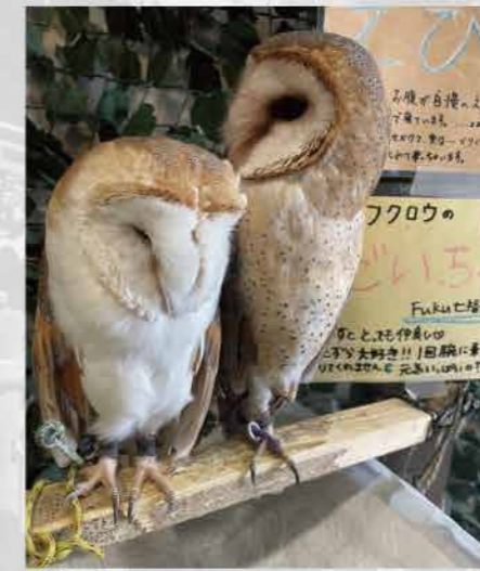
メンフクロウたち。

びびりしながらですが、慣れてくるとこの眼光も心地よく、徐々に癒やし効果を感じてきます。おとなしいフクロウなので、噛まれることもありません。ACLタイムズ初の体当たり取材になりましたが(ネタ切れではないですよ!)、ハロウィン間近、ハリーポッターな気分を味わえる「福ろうカフェ FUKU(TEL:080-9410-2960)」までぜひ足を延ばしてみてください!「ACLタイムズを見て来た」...と言ってみてください!でも特に何もありません!