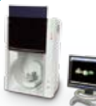
3M Lava Scan ST