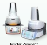
Ivoclar Vivadent プログラムット EP5010 / EP5000