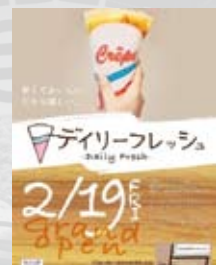
Daily Fresh 2/19オープン 鑿阿寺西通り沿い 11:30-18:30 水曜定休 (公式Instagramより抜粋)

五十部運動公園でウォーキング後に鑿阿寺までGO!と言いたいところですが…意外と離れています(笑)。健康維持から食べ歩きまで、足利はいつでも皆様をもてなしかけて仕方がないのです！ぜひ、診療の合間に足利までお越しください！