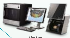
ジーシー Aadvil ML1D1 / Aadvilスキャナー