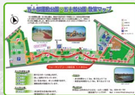
五十部公園散策マップ。広大な敷地がよくわかる。

運動後はやっぱりみんな小腹が空きますね！(笑)そこは、さっとワンハンドでパッと食べられる王道のスイーツ、「クレープ」をオススメします！県外から訪れる方も多く人気のクレープ屋さん「Daily Fresh」が、今年の2月に場所をリニューアルオープンしました。足利市民なら毎日必ず通るといふ鑿阿寺西門通り沿いという、