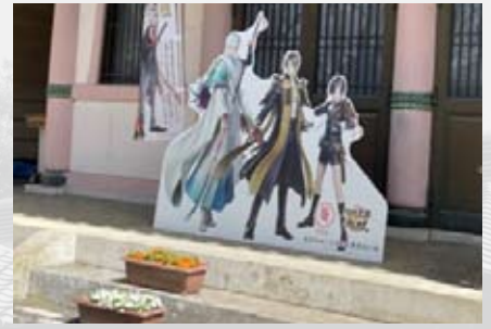
市内のあちこちに設置された刀剣男士のパネル

わしくない現代風にアレンジされた戦国武将の パネルがおかれ、それを目当てに先程の女子た ちがカメラを向けているのです。そう、彼女たち 「刀剣女子」は、市制100周年を迎えたこの足利 市とコラボレーションを実現した『刀剣乱舞 -ONLINE-』のキャラクターを目当てに全国から 集まって来てくれているのです。