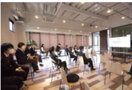
上：会場となったセミナールーム。デモの様子。 下：従業員の視聴場所となったレストラン。感染症対策のため、二箇所に映像を配信。