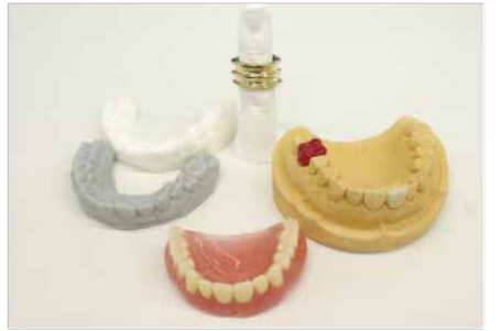
上：義歯製作に調整。下：学生が4日間で仕上げた作品。