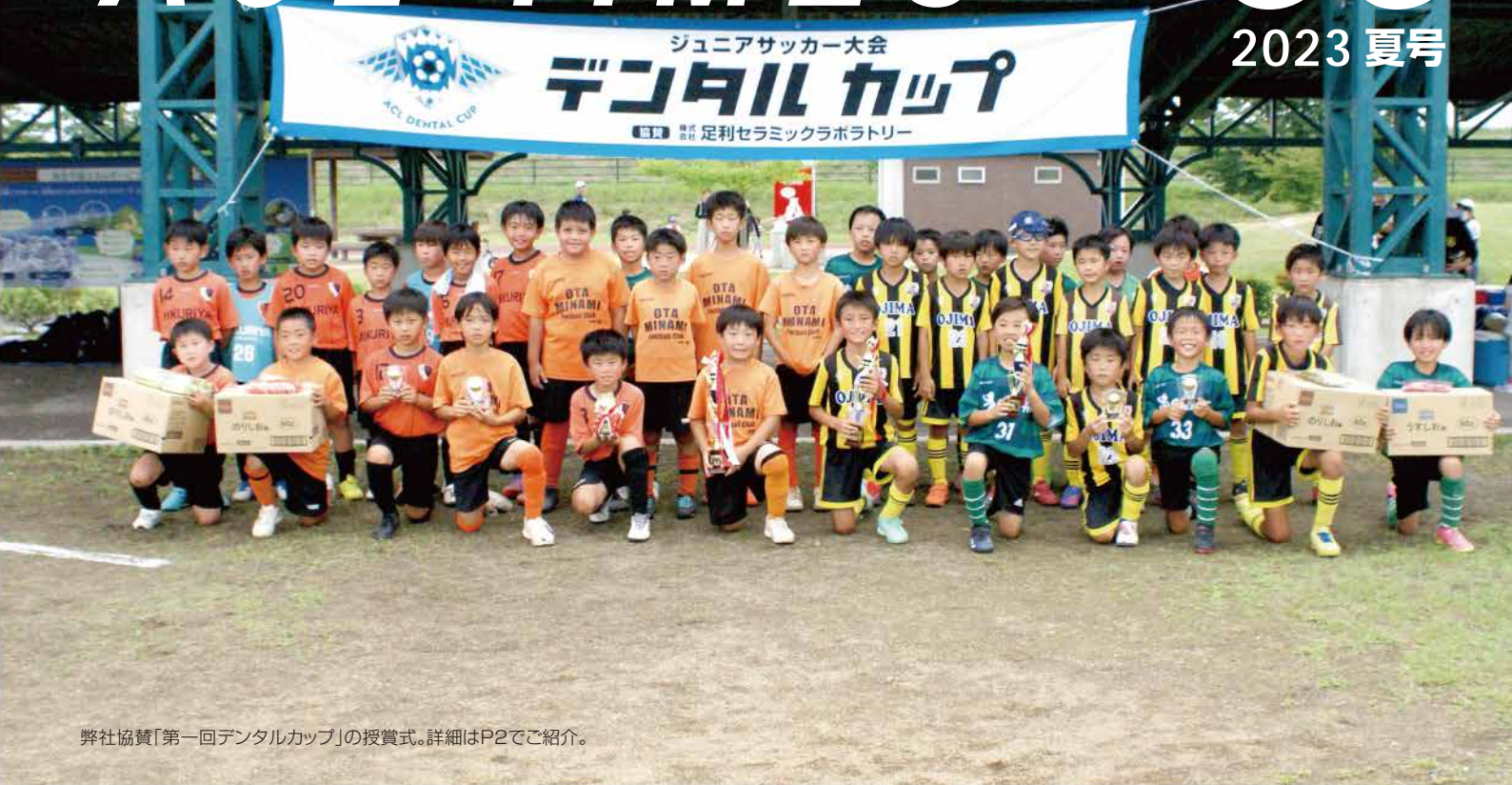
弊社協賛「第一回デンタルカップ」の授賞式。詳細はP2でご紹介。