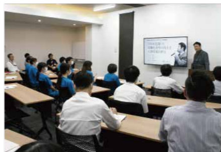
枝川先生セミナーの様子。