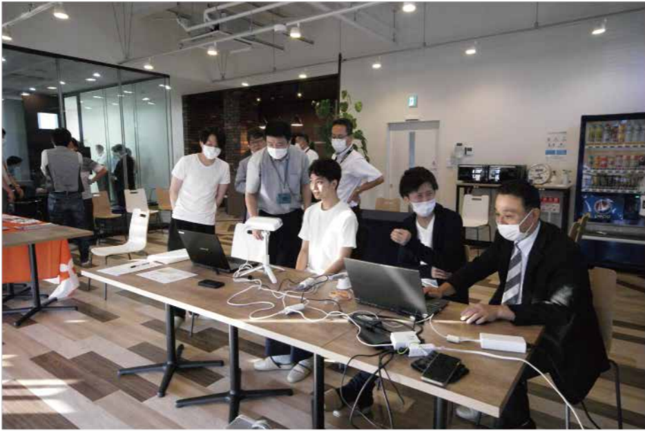
顔をスキャンするシステムを体験する参加者。弊社レストランにてブース展示が行われた。

当セミナーには、県内外から多くの歯科医師が参加され、様々なIOSメーカーからのプレゼンテーションやハンズオン体験を通じて、IOSの利点と選択肢についてご理解いただけました。プレゼンテーションでは、各メーカーのIOSの特長や利点が詳しく紹介されました。ハンズオン体験では、参加者自身がIOSを操作し、その操作性や精度を実感されていました。